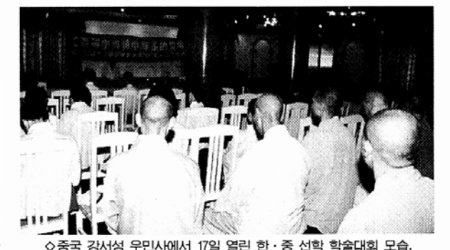
◇중국 강서성 우민사에서 17일 열린 한·중 선학 학술대회 모습.

에 관한 연구 그리고 현 대한불교 조계종의 법통에 관한 연구를 시작하는 등 영역이 점차 넓어지기 시작했다. 1990년에서 지금까지는 총 20편의 논문이 발표되었는데, 사기(私記)와 문집에 관한 연구가 시작되었고, 스님들의 법맥과 개별 사찰의 역사 연구 등이 진행되고 있다. 오종욱 기자 (gobaou@buddhopia.com)