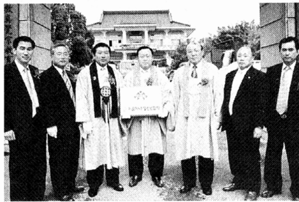
△진각종 성초 총리원장이 비로자나 청소년협회 법인설립 발대식에 앞서 현판을 들고 중한 관계자들과 기념촬영을 하고 있다.

이들 위해 △청소년 사단법인 지역 조직망 구축 △청소년 지도자 양성 △지역 청소년 문화제 개최 △각종 청소년 수련대회 실시 △종교학 관련 행사 및 불교학 생의 연수 등의 사업 계획을 구상해 놓고 있다. 또 청소년 포교 문화의 대안을 제시하고 발전시키기