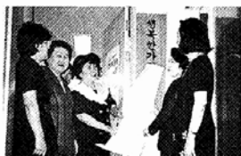
△여불련의 '행복한 상담소' 현판식.