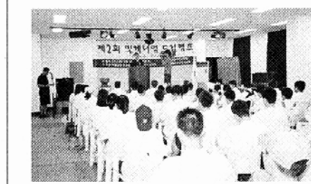
△'드림캠프'에서 청소년들이 약물남용의 심각성에 대해 교육받고 있다.

고의 목소리도 흘러나오고 있다. 비로자나 청소년협회 해명 대의사는 "급속도로 발전하고 있는 현대의 물질문명속에서 21세기의 주역인 청소년 교육은 무엇보다 중요한 과제"라며 "청소년들이 자발적으로 참여할 수 있도록 다양한 문화·봉사 프로그램을 개발 육성해 기초인성 교육과 올바른