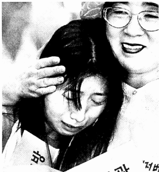
일본 여고생의 눈물 '정신대 할머니 불쌍'

97년 기준으로 우리나라 의사 수는 인구 1만명당 12명으로, 이탈리아 58명, 독일 34명, 프랑스 30명, 미국 27명 등 선진국과 비교할 때 절반 수준에 불과했으며, 간호사 수도 인구 1만명당 29명으로 독일(95명) 미국(83명) 일본(74명)보다 크게 부족한 상황이다.