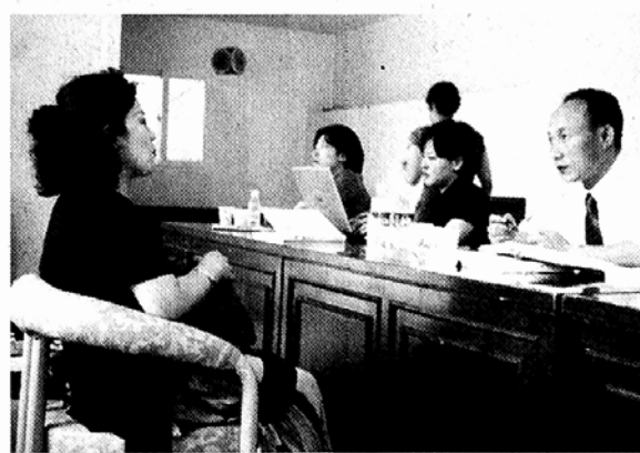
○사찰들의 홍보부족으로 법률상담은 극히 저조했다. 사진은 조계사에서 사범연수생들이 법률상담하는 모습.

(7.3~7.14)와 2차(7.18~7.31) 두 차례에 걸쳐 20명씩 사찰과 복지관에서 실시기로 한 봉사활동은 시작 첫날부터 삐걱댔다. 사범연수생 자원봉사를 받아들이는 6개 사찰 중 조계사와 관문사만 6일 까지 하루 평균 7~10명의 상담자가 있었을 뿐이고, 고양 연덕암은 이틀만에 연수생 2명을 돌려보냈다. 역지로 떠났으나 상담은 고사하고 갈길 일도 없어 돌려보낼 수밖에 없었다는 게 이유다. 또 태고사는 총무원 사회부 한쪽에 자리를 내주고 상담을 하게 했고, 봉원사의 경우는 6일 오전에야 비로소 첫 상담이 이뤄졌다. 또 총지사는 상담자가 없다는 이유로 연수생들을 역삼재가노인복지센터로 돌려 업무보조를 맡겼다. 심지어 모 사찰은 3일 당일 오전 연수생을 받을 수 없다고 해서 복지재단 관계자가 진땀을 빼기도 했다. 복지재단 관계자나 사찰 관계자들은 이에 대해 한결같이 관심과 준비부족을 시인했다. 이들은 "개인사가 노출될까 꺼리는 신도들이 상담에 적극 응하지 않을 것으로 판단돼 적극적인 홍보를 하지 않