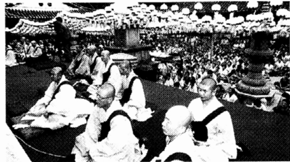
◇오는 8월14일 우린분절을 앞두고 전국의 사찰과 불자들은 23일부터 조상천도 기도법회를 49일간 봉행한다. 사진은 봉은사 우린분절 법회장면.

■'21세기 포교현실' 학술세미나=진각종과 위덕대 밀교문화연구소는 제53주년 창교절을 맞아 오전10시 한국일보 12층 송현클럽에서 '21세기 포교현실과 새로운 방향 모색'이라는 주제로 학술세미나를 연다. 02)913-0753