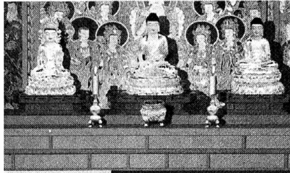
부처님을 모신 법당 앞에 흔들리는 촛불도 실감나게 재현했다.

이 직접 답변을 해주는 코너다. 고 소경물에서는 불교용품도 구입할 수 있다. 신행상담은 물론 교리의 법문을 동영상으로 볼 수 있다. (jygang@buddhapia.com)