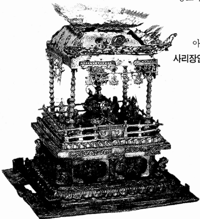
경주 감은사 동심총석탑 출토 금동전각형 사리기