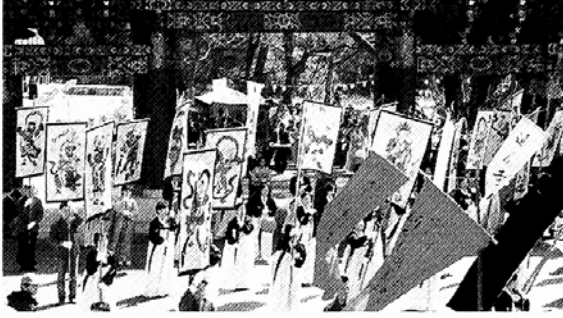
◇이런 통도사 사리진전법회는 청진주인 자장율사가 중국 당나라에서 부처님 진신사리를 모셔온 지 1400년만에 처음으로 볼 수 있는 기회다. 사진은 통도사 패물 이운식장면. ■통도사 진신사리 이운식=통도사는 정오 부도전 및 성보박물관 입구에서 부처님 진신사리 이운식을 갖는다. 사리 진전은 6월2일부터 7월30일까지 통도사 성보박물관 중앙홀에서 열린다. 0523)382-1001