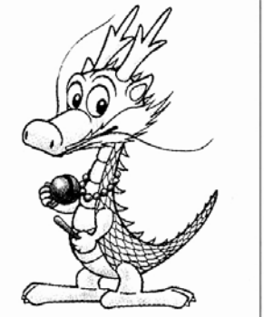
해동용공사 캐릭터 '용돌이' 상표 등록

7년간 진주시 계동에 소재했던 진주불교회관은 상봉동 1018-3번지구 농촌지도소 건물로 이전, 법당을 넓히고 불교도서관을 개설했다. 김재경 기자