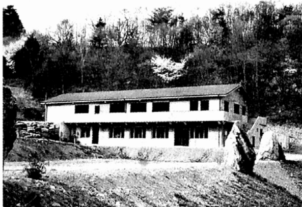
하루 일과와 공양을 듣고 율력을 하면서도 염불을 계속하는 철저한 정진을 하고 있다.

현재 수행원에 상주하고 있는 재가불자는 10명, 새벽 예불 및 수행, 행선, 도인체조, 율력, 저녁 예불 및 수행 등으로 이어지는 빈틈없는