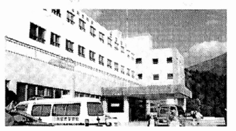
▲ 효성양방·한방병원 부분전경

천하의 명산 울산 가지산(경남도립공원) 자연공원에 의료법인 태영재단은 현재 380억원을 투자하여 9만평의 대지위에 노인복지 시설인 효성노인병원, 양방·한방병원 300병실과 104실의 실버타운을 운영하고 있습니다. 앞으로 본 의료법인의 자금과 불사(佛事) 시주금으로 마련한 4백억을 투자하여 건축허가분 실버타운 300여실을 증축하고 한국목탑(木塔)형식의 3층 병당(150평규모), 세계 최대규모인 108미터 열반와불(臥佛)상과 10만위(位)의 영골(靈骨)을 모시는 영묘사리탑(靈廟舍利塔), 열반 와불의 테마공원 등을 조성하고자 합니다. 정신병, 신경성 질환, 당뇨병, 중풍(외사풍 포함), 관절염, 위장병, 치매 등을 앓고 있는 노인분들이 완치될 때까지 무료로 치료해(약 1개월안에 치료 가능, 입원실 사용, 식대 각자 부담) 드리하고자 하오니, 전국의 불자 여러분분의 많은 관심과 이용을 부탁드립니다.