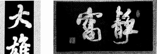
◇고창 선운사 묘사의 편역.