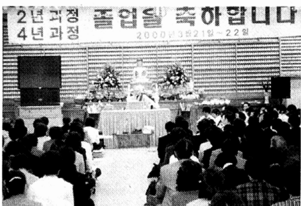
영남불교대학은 21일과 22일 주(170명)·아간반(350명) 졸업식을 거행했다. 영남불교대학은 올 봄학기예 2천6백40명이 새로 입학했다.

봉사 갖기 운동'으로 복지과 봉사부에서 신성한 바램을 일으키고 있으며, 지역민들의 어려움을 상담하는 '지혜의 전화'(053-474-0108)와 인터넷 불교대학(www.cyberbuddha.or.kr) 운영, 다도·불화그리기 등 14개 문화강좌가 시민들의 호응을 얻고 있다. 특히 창건 이래 동문들이 100일간 10만배 기도성취, 100일·1000일기도, 10년간 2만여명의 졸업생을 배출하며 포교 전초기지로서의 역할을 톡톡히 해 온 영남불교대학은 대구지역 불교연합단체가 이루지 못한 지하층 지상5층 규모의 불교회관을 건립, 불자들의 문화공간과 시민선방을 제공하는 등 지역신행의 중심지로 성장했다. 18년의 전통을 가진 부산불교교양대학(학장 이하우)은 전국 최대인 739명의 포교사를 배출해 다양