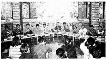
◇대불련은 11일부터 2박3일간 대전 대전정사에서 지부장단회의를 열고 새해 사업 계획을 확정했다.