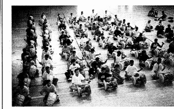
◇우리의 전통 예술문화에 대한 우수성을 체험하며 배우는 전통예술축제 한마당.

1987년 스리랑카의 라자니데실바, 미국의 카르마 렉시소머 등 4명의 여성 불교학자에 의해 인도 부다가야에서 처음 시작한 이 행사는 방콕(2차), 콜롬보(3차), 리다크(4차) 캄보디아(5차) 등 2년마다 동남아 불교국가에서 열려왔다. 김주일 기자 (jikim@buddhapia.com)