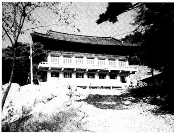
◇올해 8월 사미니강원을 개원할 예정인 안성 용응사. 현재 강원 건립공사가 한창이다.