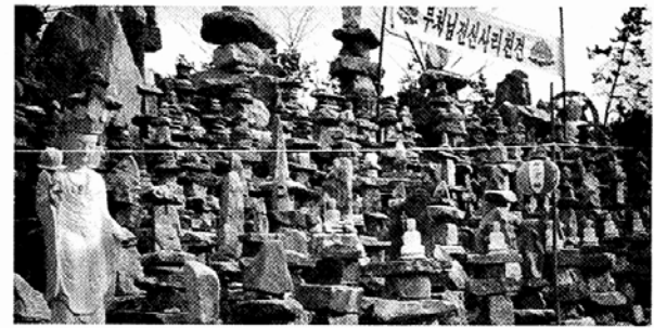
음천사 주지스님이 경내 자연석탑을 직접 쌓고 있다.