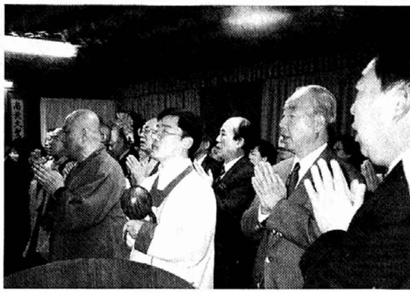
12일 개원법회를 개최한 거암관음사는 재가불자 수행운동을 전개한다.

로서 면모를 갖췄다. 특히 주법사인 서울은행 불자들이 IMF 구조조정 어려움을 이겨내고 차질없이 사찰을 개원한 것이어서 의미를 더했다. 거암관음사는 사찰재정공개를 통한 운영의 투명성을 실현하기 위해 회원들로 구성된 감사제도를 도입했다. 조직도 공부, 봉사, 보살, 거사, 직장으로 분류하여 5개법 등으로 나눠 각기 특성에 맞는 법회와 수행운동에 참여할 수 있도록 한다는 방침이다. "지혜를 밝히는 공부하는 사찰"을 모토로 하고 있는 거암관음사는 법등을 중심으로 근기에 맞게 불교교리공부에 매진하고 있다. 또 일반인들에게도 개방되는 '해(慧)로