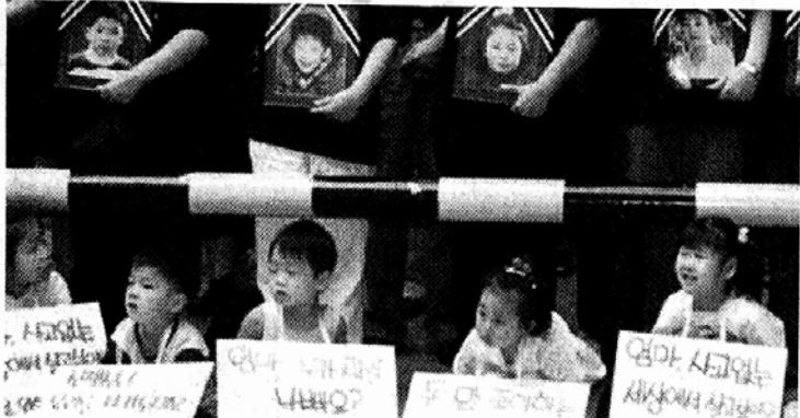
◇200여 어린 생명을 앗아간 화성 씨랜드 화재참사는 우리사회에 안전불감증이 얼마나 뿌리깊이 배어 있는가를 여실히 보여준 사건이다. 사진은 정부의 보상을 요구하며 시위를 벌이고 있는 피해자 유족들.