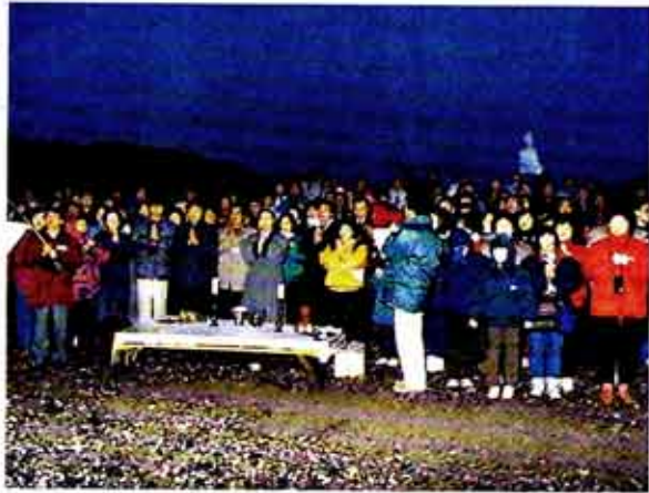
◇철이도정진 등 경건한 발원을 위해 사찰에서 새해를 맞는 불자들이 늘고 있다. 사진은 경주 대왕암굴 일출법회에 참가한 불자들.