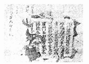
◇석가탑안에서 나온 무구정광대다라니경

진단했다. <무구정광경> 종이는 부식되고 심한 산화로 부스러져 책머리의 표제, 한역자 및 본문 11행을 잃었으며, 또 앞부분에서 약 250cm까지는 같은 간격으로 1.2향씩 결실되었을 뿐 아니라 여러 조각으로 분리된 상태였다. 그리고 그 뒤로는 상태가 약간씩 좋아지며 권말에 이르러 완전하였다. 시급히 과학처리를 하여 보존과 복원을 도모해야 한다는 전문가 의견이 나왔으나 손도 못대다가 20년이 지난 1988년 9월이 되어