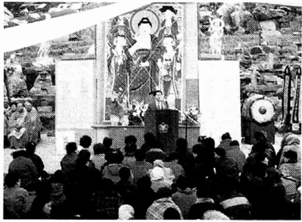
○원각종 호남 종무원은 11월 26일 국태민안과 남북통일을 기원하는 법회를 갖고 불자들이 앞장서 자유와 평화의 새시대를 만드는 데 앞장서기로 했다.

某 여행사가 제작한 팸플렛의 경우, 雁鴨池(안압지)를 雁壓池로, 聖德大王 神龕(성덕대왕신龕)을 聖德大王新龕으로 표기하는 등 외국인들이 이해할 수 없거나 전혀 엉뚱한 의미로 되어 있어 교정이 시급한 실정이다.