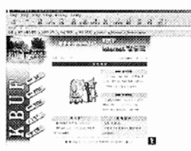
◇kbuf 인터넷방송의 초기화면.

음악방송코너에서는 대학생법우들의 사연과 신청곡을 접수받아 최신음악을 소개하고, 영상방송코너에서는 지난 여름 실시했던 대불련 총연합대회 축하공연을 감상할 수 있는 영상갤러리 다시보는 여름대