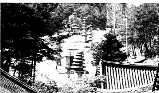
◇대상 수상작 '운주사 천불천탑의 비밀'은 천불천탑과 별자리 칠성신앙의 관계를 새로운 시각에서 조명했다.