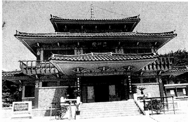
◇일반인에게도 개방돼 수행과 성찰, 포교의 공간으로 자리를 넓혀가고 있는 동국대 경주캠퍼스 정각원.