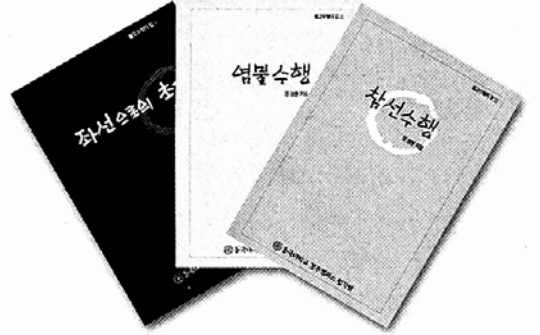
◇수행방법을 구체적으로 제시한 작은 책자 '좌선으로의 초대' (영불수행) '참선수행', 학생들뿐 아니라 일반인들에게도 호응이 높다.