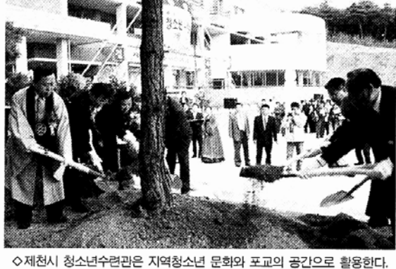
◇제천시 청소년수련관은 지역청소년 문화와 포교의 공간으로 활용한다.