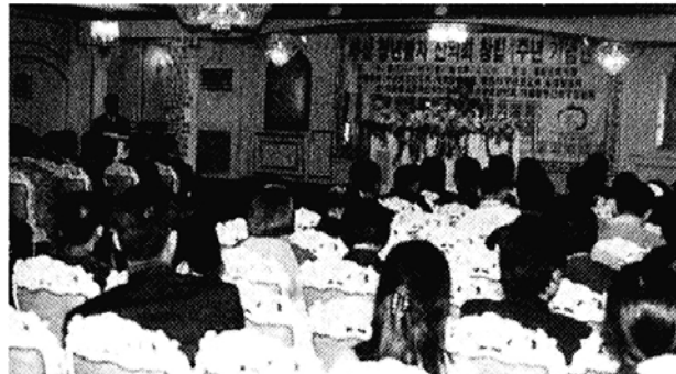
부산불교청년산악회는 21일 첫 생일을 맞아 1년간의 활동을 정리하고 우수회원 표창과 등산장비 전시회를 가졌다.