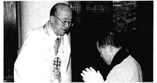
진각종 낙자·죽비 가지 관정 불사

모범으로 우뚝 서도록 또 한해를 꾸려나갈 것'이라며 '자신의 맑은 심성을 향한 걸음이 될 산행에 함께 하자'고 권유한다. 부산불교청년산악회는 큰산을 오르는 느긋함으로 문화, 레저, 신행을 접목시킨 실험적 모델을 제시하며 청년불교의 큰 맥을 이끌어 나갈 것으로 기대를 모은다.