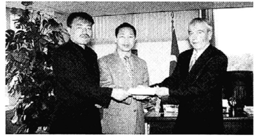
불교기아기구 터키에 천만원 기탁

조계사(부주지 지홍)는 18~20일 3일간 보살계 수계산림 대법회를 봉행했다. 이번 법회는 첫날과 둘째날 무진장스님과 정락스님의 법문에 이어 마지막날인 20일에는 수계식이 열렸다. 고산스님이 계사로, 정락스님이 갈마아사리로 무진장스님이 교수아사리로 나선 수계식에서는 4백50여명의 불자가 계를 받았다.