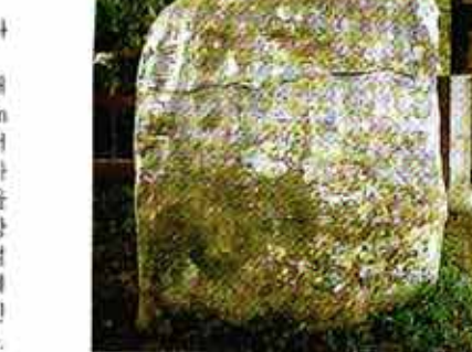
◁매향의 풍속을 기록하여 역사적 자료로 평가받은 고려시대 사천매향비(원목)와 지 난 10일 망해사에 세운 금산사 매향비.