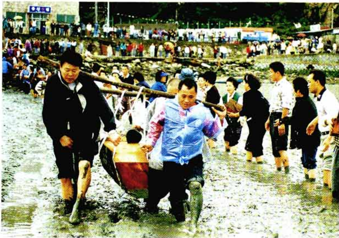
◁ 고려종가양식의 대표적 삼천사 마애 여래입상.

◁ 희망찬 새천년을 기원 하여 사부대중이 하나되어 큰 향목을 어깨에 메고 불 밭으로 나르고 있다.