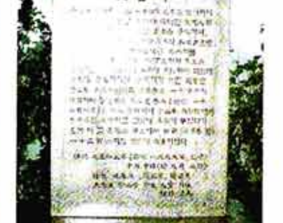
◁매향의 풍속을 기록하여 역사적 자료로 평가받은 고려시대 사천매향비(원목)와 지 난 10일 망해사에 세운 금산사 매향비.