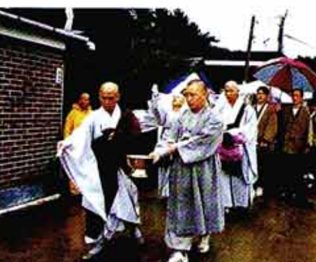
◁금산사회주 림주스님과 주지 도영스님이 향목이 지나는 길을 정확히시키기 위해 향목수를 뿌리는 채수행 하고있다.