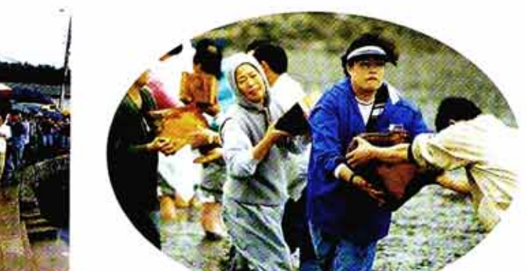
◁매향할 향목을 손에서 손으로 정성들여 옮기고 있는 불자들.