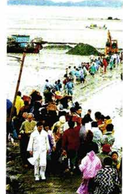
◁진종신 정상 서쪽 1500m지점 심포항 앞바다에 매향을 하고있는 불자들. 포크레 인인 향목이 묻힐 뻔할을 길게 파놓았다.