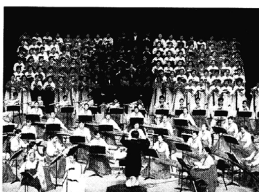
◇문화부지정 해초의 달을 기념한 청각국악교성곡 '해초' 공연.