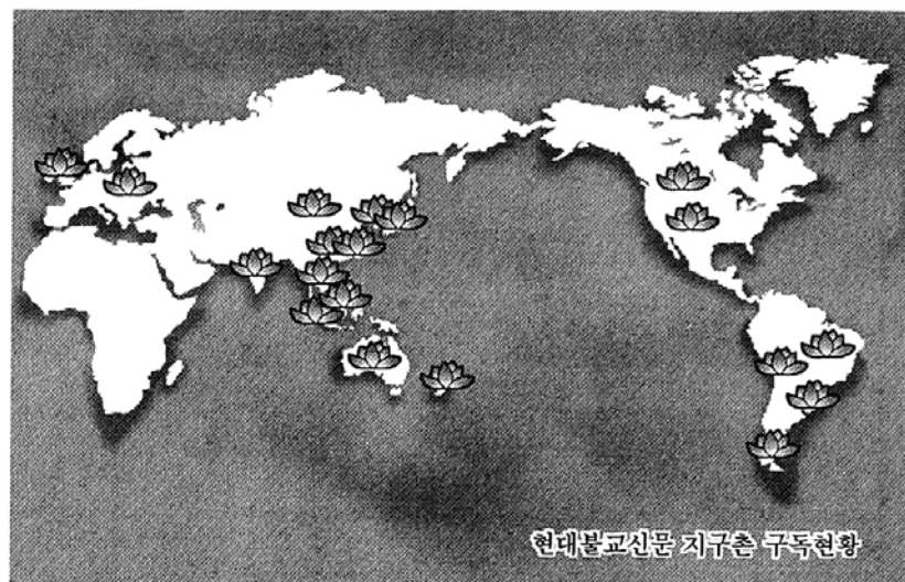
현대불교신문 지구촌 구독현황