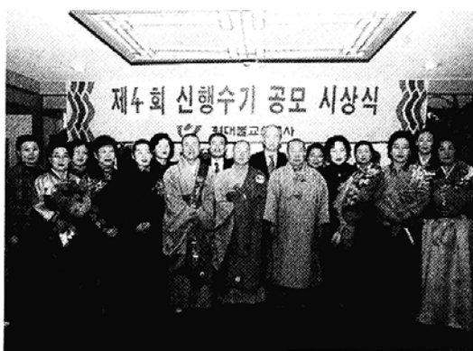
◇매년 실시하는 신행수기공모는 신행바람을 불러일으키며 정평을 받고 있다.