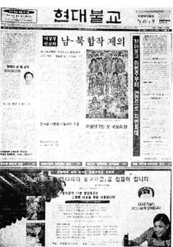
◇94년 10월15일 창간호(사진위)와 97년 10월1일 24면 증면호.