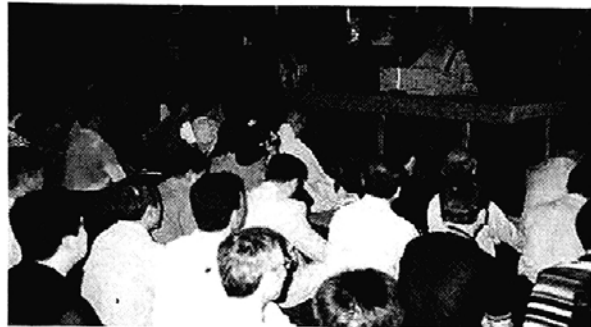
◇영·호남 운불자들은 친선법회를 열고 지역화합의 초석이 될 것을 다짐했다.