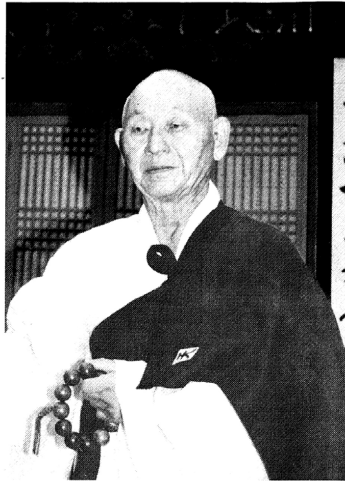
이르는 것은 선이요, 말 있음으로써 말 없는 데 이르는 것은 교이다. 마음은 선법(禪法)이요 말은 교법(敎法)이다"고 설했습니다.

교론은 공(空)을 설하여 유상(有相)의 집착을 버리게 하기 위한 것이며, 조사선(曹山)의 목적이 언하(言下)에 활연대오(豁然大悟)케 함으로써 언어와 문자에 사로잡힌 분별을 끊고 자기의 '선령스런 빛(靈光)'이 천지에 비치게 하는 것으로 목적이 다르지만 모두 필요하다는 설명입니다.