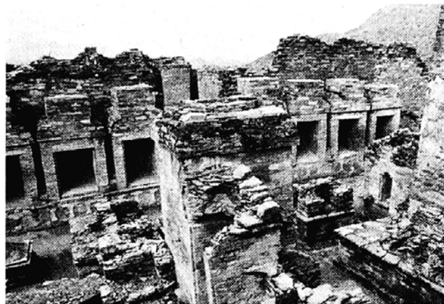
◇최초로 발굴된 산악 사원인 탁트바히사원 모습.