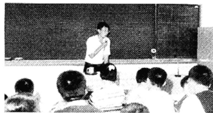
대전 청소년불자 농촌봉사

대전청소년자원봉사센터(소장 종실)는 11일~13일 3일간 '99 청소년 농촌봉사활동(사진)을 실시했다. 대전시 유성구 관평동 소재 낄망길 농원일대에서 펼친 이번 봉사활동에는 총 58명이 참가해 파수원 잡 초재, 낙과일 줍기, 농약병 및 폐비닐 수거등의 활 동을 펼쳤다. 또 식량과 농촌문제, 음식물쓰레기와 생 활환경 특강과 농민과의 대화를 통해 농촌의 현실을 이해하고, 함께사는 공동체 의식향양과 환경보존의 중요성을 다시한번 깨달았다.