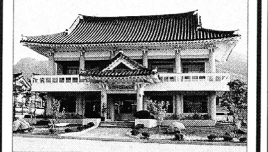
전남 순창 고추장 단지