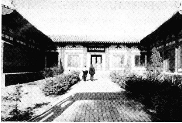
◇ 불교방송은 숨겨진 고구려와 발해의 불교 문화 유적을 조명할 역사 기행 다큐를 추석특집으로 방송한다. 사진은 발해 불교유적인 흥륭사 전경.

론 잃어버린 우리 민족의 얼과 혼 을 조명할 이 프로는 방학방교교 (연번대)의 안내로 범문스님(정토 회 지도법사)과 불교방송의 박상필 PD가 8월7일부터 15일까지 중국의