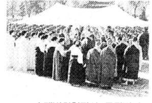
◇수계법회현장의 군장병과 불교어머니회 회원.

불교어머니회는 이미 97년 논산 훈련소 원법당 호국연무사 중창불 사를 성공적으로 이끌어냈다. 8백 명수요의 법당을 3천명이 동시에 참여할 수 있는 대설법전으로 여법 하게 이뤄놓은 것. 대법당 건립을 위해 불교어머니회 회원들이 전국 의 각종 불사와 법회현장을 찾아다 니며 눈물겨운 모금활동을 벌인 결 과였다. 이곳 논산훈련소에서 수계 를 받고 불자로 태어난 군장병수는 지난 10년간 17만명이 넘는다는 것 이 회장 김반야상보살의 설명이다.