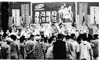
▷포리미타 청소년 회원들은 오대산 수련장에서 심신을 단련시켰다.