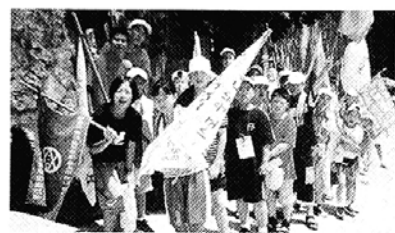
▷무더운 날씨에도 인천 전지역을 순회하는 청소년 불자들.

제4회 파라미타 청소년연합회 연합캠프가 6일~9일 강원도 영월군 진부면 오대산 수련장에서 펼쳐졌다. '부처님 품안서 하나되는 우리'를 주제로 열린 이번 연합캠프에는 파라미타청소년회원 850명, 지도자 250명 등 총 1100명이 참가했다. 참가자들은 2박3일간 단주만들기, 친불친담합기, 직지인쇄체험, 108기도, 적멸보궁참배, 월정사 도보순례 등 다양하고 알찬 신행체험활동을 통해 심신을 단련하는 한편 단국에서 참가한 회원들과 돈독한 우애를 다졌다. 최경수 명예기자