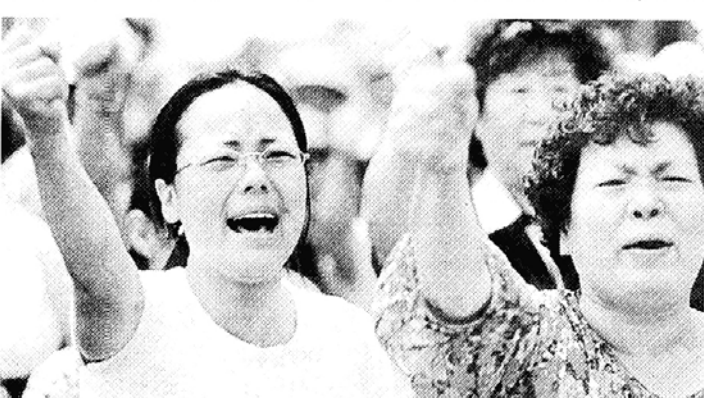
"天災아닌 人災" 수재로 큰 피해를 입은 파주시 문산읍 주민들이 지난 4일 시가지에서 행정당국의 허술한 방재행정을 비판하며 대책을 요구하는 시위를 벌였다.

▲호우시 물을 저장해 두었다가 바다쪽으로 흘려보내는 유수지의 확충과, 이번 수해가 하수구 정비 미비로 인한 역류현상 피해의 최대원인으로 지적됐듯이 이에 대한 대책마련은 무엇보다도 시급하다.