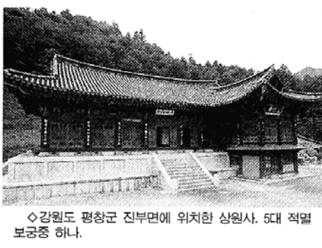
◇강원도 평창군 진부면에 위치한 상원사. 5대 적멸보궁중 하나.

■ 강원도 적멸보궁 참배=우리문화기행은 15일까지 2박3일간 강원도 평창 상원사, 영월 법흥사, 태백 정암사 등의 적멸보궁으로 참배를 떠난다. 영월, 동강과 청령포도 둘러본다. (051)466-4080 ■ 남해 보리암 참배=답사여행의길잡이터사람은 14일까지 남해 보리암으로 참배를 떠난다. 미호항, 관음포 등 남해의 아름다운 경관을 감상한다. (02)725-1284