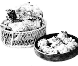
◇ 김·미역 부각