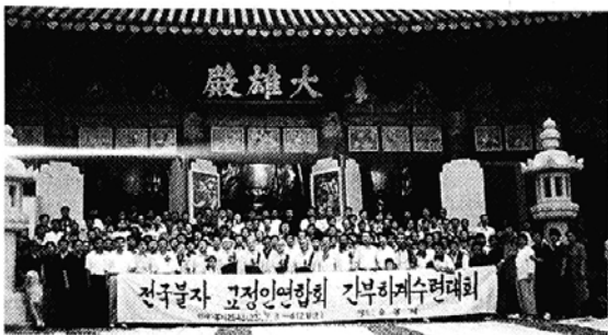
○3·4일 원주 송광사에서 열린 수련회는 전국불자교정인들이 심신을 쉬며 참교정인으로서 새롭게 태어나는 기회가 됐다.