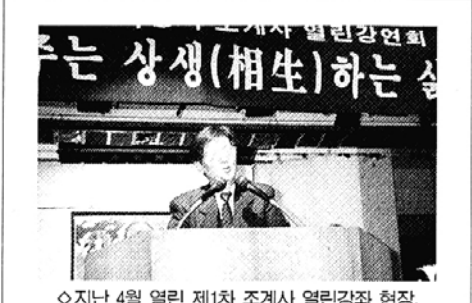
◇지난 4월 열린 제1차 조계사 열린강좌 현장.

■ 미화사 철야기도 및 무위사 참배=용진선행회는 오전 9시 달마산 미화사 철야기도 및 월출산 무위사 참배를 떠난다. 진도 바닷길도 둘러본다. (02)2279-1191