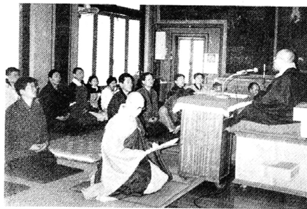
정법회는 지난 3월 13일 봉선사에서 첫 수계법회를 가졌다.