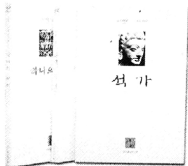
책가 하나의 의미 사색인의 염주