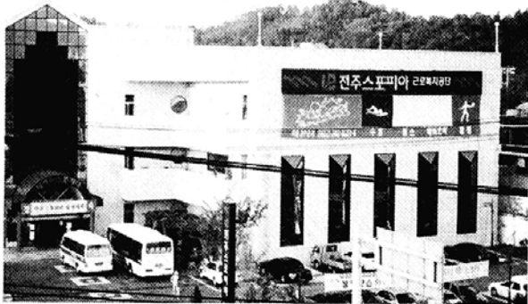
◇조계종 복지재단은 부천과 전주에서 2곳의 스포피아를 위탁운영하여 지역포교에 새로운 전기를 마련한다. 사진은 전주스포피아 전경.