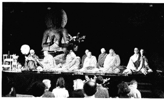
독일 보문사와 베를린 불교연합이 공동으로 개최한 봉축행사.

프랑스 파리 외곽에 위치한 송광사 파리본원 길상사와 관음선센터는 23일 봉축법회와 수계식을 봉행했다.