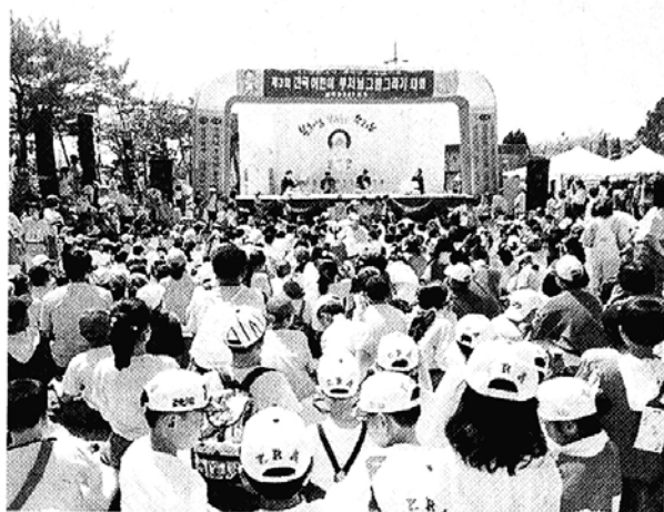
◇청소년단체 봉축행사 일정

명성여고 관음상 봉안·탑돌이·염주제작 동대부중 학급별 연등경연·자비의쌀 모금 청교련 무용·국악등 종합예술 경연대회