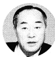
송석구 (동국대 총장)

"생활의 고삐를 늦추지 않고 항상 부지런히 움직이려고 합니다. 과다한 업무나 일정을 스트레스로 받아들이기 보다는 즐거운 마음으로 기꺼이 임하는 자세가 오히려 활력을 주지요." 지난 2월25일 제14대 총장으로 재임한 후 그 어느 해 보다도 바쁜 하루하루를 보내고 있는 동국대 송석구 총장(61). 학교 행정을 전두지휘해야 하는 지금의 자리는 단 1분도 자신만의 시간을 허락하지 않고 바쁘게 돌아가지만 그 속에서 개인적 즐거움을 찾으려고 노력한다. "학교가 외형적으로나 내형적으로 조금씩 변화하는 모습을 지켜보면서 '나의 모교가 발전하고 있다'는 생각을 하지요. 모든 일을 긍정적으로 생각하는 동시에 내 일처럼 여기는 마음가짐은 정신건강은 물론 육체적인 건강에도 도움