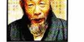
사의 위치 등 상당수의 저서와 논문을 남겼다.

특히 운제스님은 조선시대 건국대 교수시절 불교학행회를 지도하고 지성인 불자들을 양성, 불교인재봉사에 큰 공로를 세웠다. 서울시 교육감, 뇌하학술상, 대한교련상, 국민훈장 목련장 등을 수상한 바 있다. 18일 영결 다비식을 가졌다. (자주상보) 한명우 기자