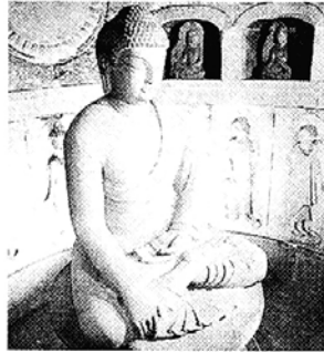
◇천년고도 신라의 황기가 물어나는 경주 석굴암을 찾아 가자.

간 석굴암 일출을 감상하고, 석굴사원인 사찰건축을 조명하는 기행을 떠난다. 경주 벚꽃길을 따라 신라의 남산 자락도 감상한다. 밤 9시에 출발한다. (02)725-1284