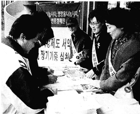
◇21일 지정도량 심원사에서 열린 생명나눔실천 캠페인.