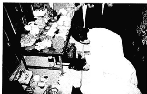
◇사찰에서 차례를 지내며 남다른 설을 맞이하자.

■ 붓다의 메아리 축제=대한불교청소년교화연합회 서울지부가 재48회 붓다의 메아리 축제를 오후 2시 중앙승가대 대강당에서 연다. (02)720-9139