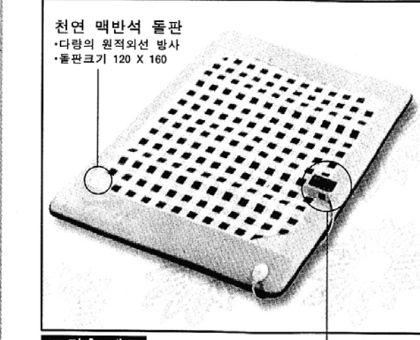
천연 맥반석 돌판 · 다량의 원적외선 방사 · 돌판크기 120 X 160 그린홈 매트 침단 온도조절기 · 전자파 차단 필지