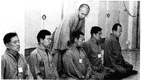
주말 시민선방에서 일주일간의 번뇌를 씻어버리고, 새 삶의 정기를 되찾아보자.

■선학원 시민선방 철야참선법회=선학원 중앙선원 시민선방은 참선수행에 관심있는 직장인들을 위해 매월 셋째주 토요일 오후 8시~다음날 새벽 4시까지 철야참선정진법회를 갖는다. 중앙선원 원장 상해스님이 직접 지도한다