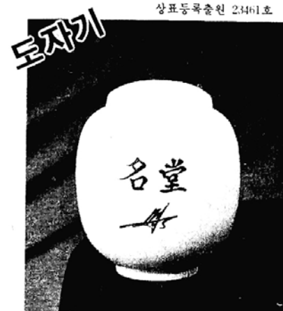
조상을 편히 모셔드리는 명당도자기

놀라운 것은 이러한 종합적인 명당자리 요법을 통하여 정신병 환자가 호전 반응을 일으키고 치매, 신근 경색증 환자가 양호한 상태로 변화되는 등 실제 임상을 통하여 입증시킨 새로운 학문으로 각광을 받게 될 것이며 다가오는 21세기의 의학계 발전에 이바지 할 것이다.