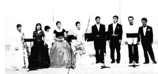
불자성악인 '찬불가의 밤' 개최