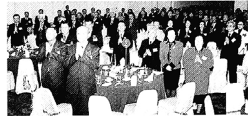
동국대총동창회 '동국인의 밤'

새불교승가회(공동의장 진관 석담)는 13일 능인선원에서 2천여명의 사부대중이 참석한 가운데 저소득 실직가정의 겨울나기를 위한 쌀모으기 법회를 봉행했다. 의장 진관스님을 비롯한 선재 도관 종진 혜도스님 등 회원스님들이 직접 수거법회에 나선 이날 행사에서는 40kg짜리 80가마가 모였다.