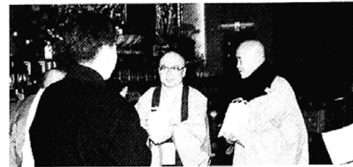
새불교승가회 실적자담기 '쌀모으기'