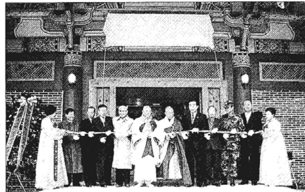
◇대문사는 17일 대웅보전 중창불사 및 성보박물관 개관식을 봉행했다.

진부 월정사(주지 현해)는 22일 큰법당에서 제1회 불교청년회 연합 법회를 봉행했다. 이날 법회에는 월정사 불교청년회를 비롯 교구 관내 10여 사찰의 불교청년회가 참석했다. 월정사는 이날 관내 소년소녀가장 10명을 초청, 총 3백10만원의 장학금을 전달했다. 김종근 기자