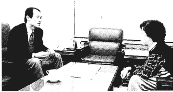
◇천태종 관문사는 3일부터 무료법률상담소를 개설, 매주 화·목요일 법률적으로 어려움을 겪고 있는 신도 및 지역민들에게 상담을 해 주고 있다.