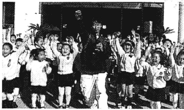
▷ 불교TV와 불교방송의 어린이 포교 프로그램이 인기를 끌고 있다. 사진은 불교TV의 '모여라 부처님나라'의 한 장면.

그림과 함께 불교를 설명 해주는 '그림으로 보는 불교이야기' 등도 마련돼 있다. 매주 일요일 오후 3시5분부터 오후 4시까지 55분간 방송되는 불교방송의 '톨니비동산' (담당PD 한지운)도 새싹불자 포교에 가세했다.