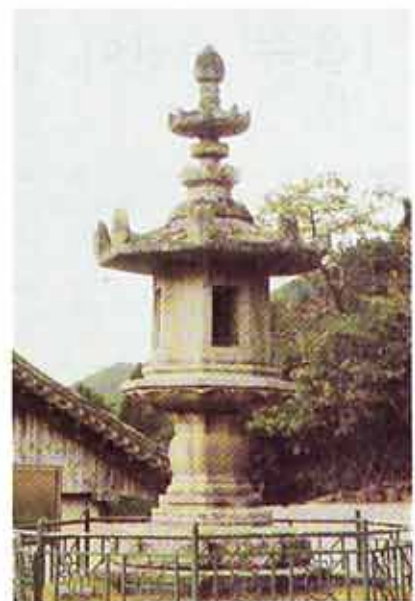
△불성을 밝혀주는 법등이 형상화된 석등. 화엄사 석등(국보 제2호).