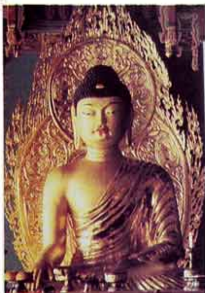
태양의 불꽃같은 불상의 광채는 진리와 광명 지혜를 상징한다. 부처사 조소여래좌상(국보 제45호).