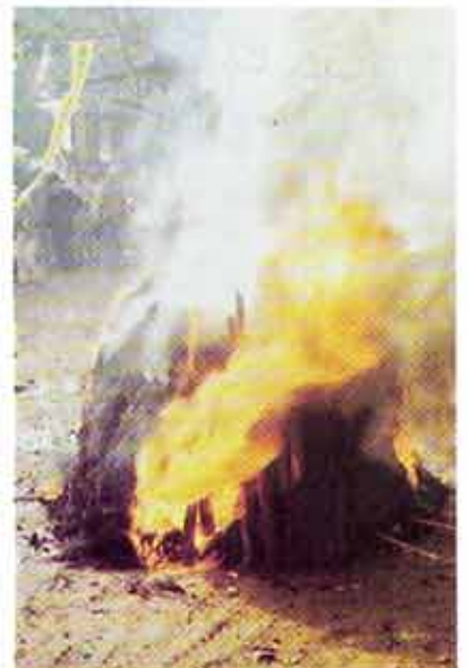
△심계의 번뇌를 끊어 무위의 세계로 들어가는 대비의식.

강박한 중생의 마음을 부처님의 진리로 비추어 불성을 밝혀 주는 법등은 석등으로 형상화 되어