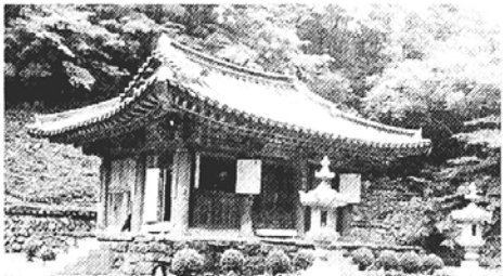
◇아름다운 가을, 부처님의 가르침이 어려있는 적멸보궁 순례에서 마음의 결실을 맺자. 정암사 적멸보궁.

■ 화엄십신계 수계법회 =우리는 선우가 창립 7주년을 맞아 오후 2시 수유리 화계사에서 화엄십신계 수계법회를 봉행한다. (02)278-8672