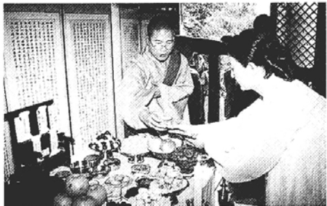
▷전국 각 사찰에서는 중추절을 맞아 추석차례불공을 봉행한다. 사진은 지난해 천주사의 추석차례법회.